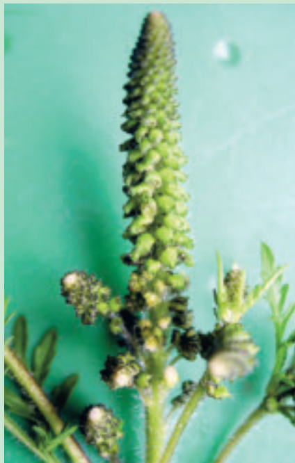
August und September ist die Hauptblütezeit, späte Pflanzen blühen bis im Oktober.